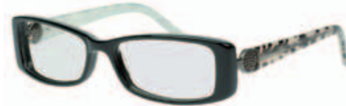
3 Beispiele aus unserer NOTOS EYEWEAR-Kollektion.